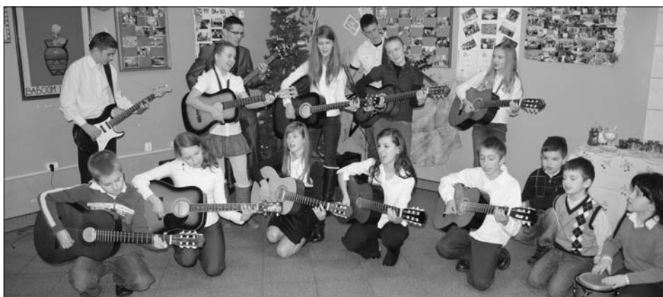
Zespół gitarowy z Dobrzyniówki zachwycał wszystkich zebranych