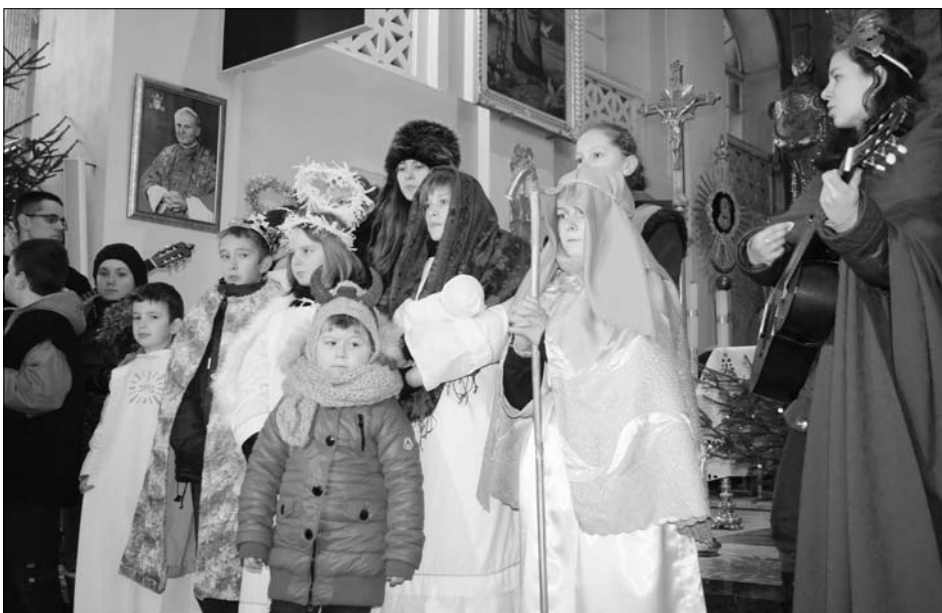
Kolędy śpiewają dzieci z Dobrzyniówki