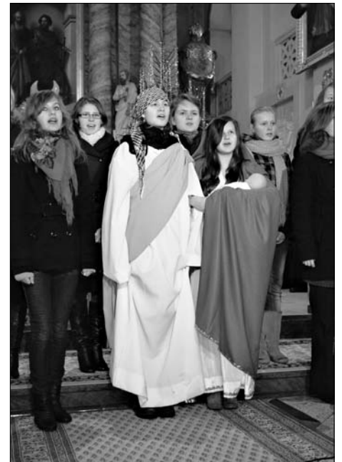
Schola młodzieżowa z parafii katolickiej w Zabłudowie

Ponadto w kościele wystąpiły: schola dziecięca i młodzieżowa oraz grupa wokalnie – muzyczna z parafii pw. św. App. Piotra i Pawła, zespół dziecięcy z Dobrzyniówki, zespół z Ryboł oraz gościnnie zespół z Czarnej Wsi Kościelnej.