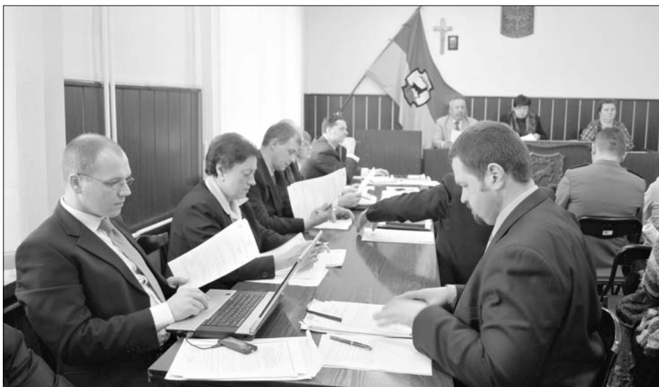
Radni podczas styczniowej sesji

Każde z w/w działań będzie współfinansowane przez gminę do 50% wartości. Dotacja zostanie rozliczona po zakończeniu inwestycji, na podstawie kosztorysu powykonawczego.