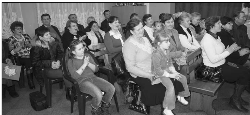
Dopisała publiczność i zaproszeni goście

znane polskie piosenki na 12 gitar. Natomiast dorośli, czyli zespół „Barwianka” zaśpiewał „Podlaską balladę”, „Cyt cyt”, „Fajnie jest spotkać się” i kolędę „Bóg się rodzi” oraz utwór „100 lat” w specjalnej aranżacji przywiezionej z województwa świętokrzyskiego.