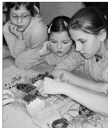
Układaniem koralików szczególnie zainteresowane były dziewczęta