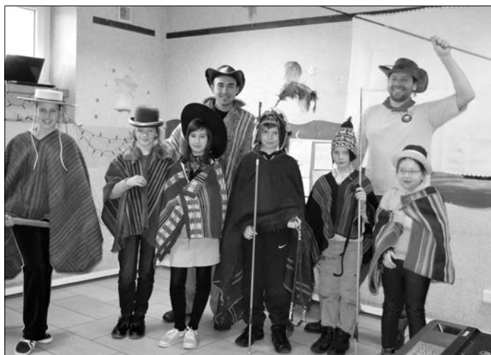
Dzieci z podróżnikami z Ameryki Południowej