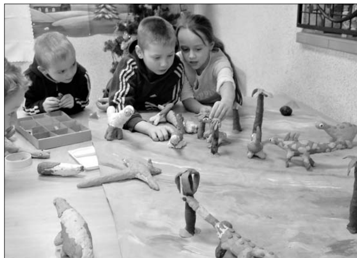
Dinozaury z plasteliny zagościły w klubie