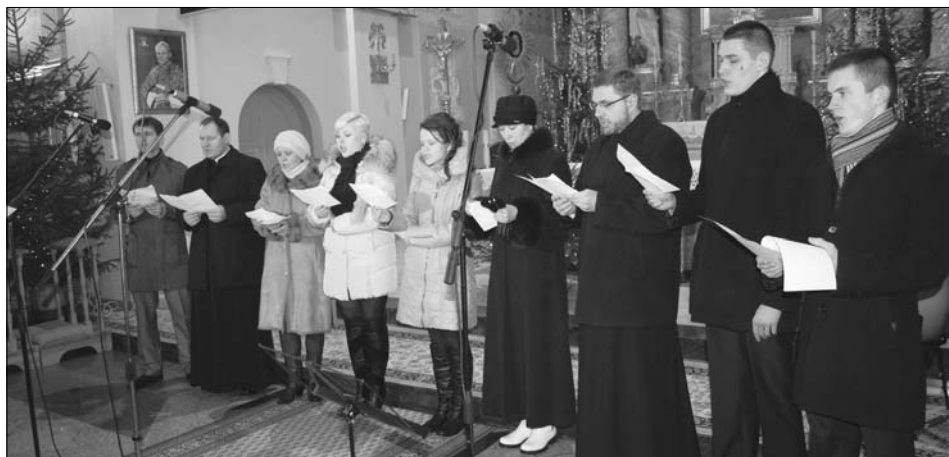
Występ chóru z parafii prawosławnej