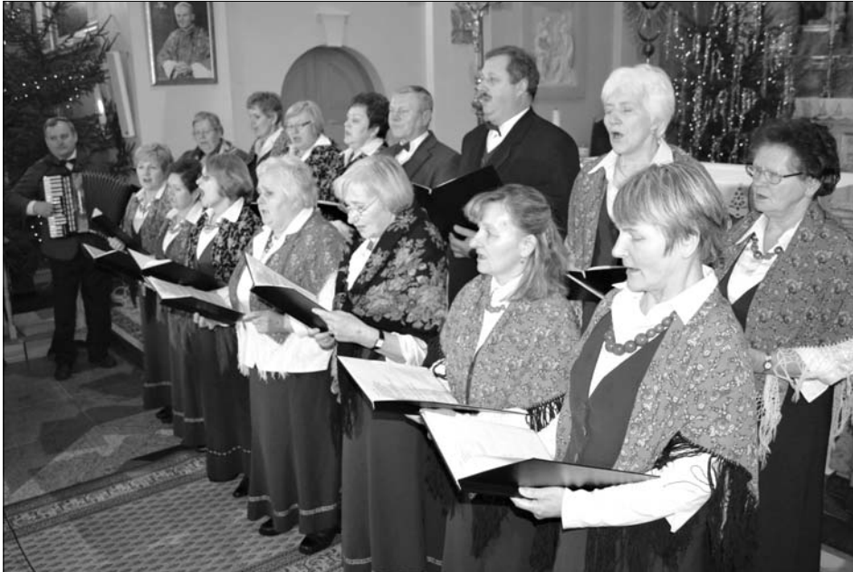
Zespół „Barwianka” zaskoczył kolędami w trzech językach

Kolędy w wielu aranżacjach i językach rozbrzmiewały 15 stycznia br. w zabłudowskim kościele podczas „Drugiego wspólnego kolędowania”. To była prawdziwa „uczta duchowa” dla ucha.