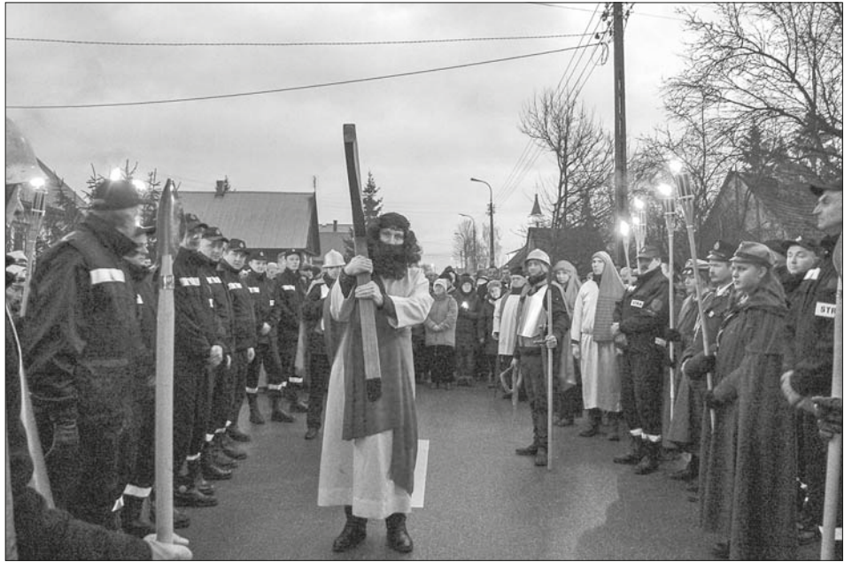
Droga krzyżowa ulicami Zabłudowa

Miejszem wydania wyroku na „Jezusa Chrystusa” były bramy parafialnego kościoła, gdzie żołnierze bicząc nałożyli krzyż na Jego ramiona i poprowadzili ulicami: 3 Maja, następnie Szkolną i Surazską, aż do centrum miasta, gdzie na placu pośród ludu „Syn Boży” został ukrzyżo-