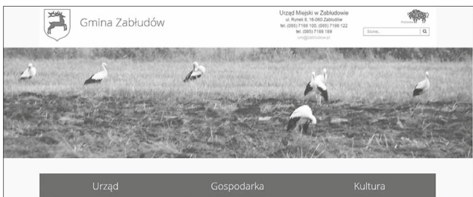
Strona główna nowego serwisu internetowego Gminy Zabłudów

Niech Zmartwychwstanie Pańskie, które niesie odrodzenie duchowe, napęłni wszystkich spokojem i wiarą, da siłę w pokonywaniu trudności i pozwoli z ufnością patrzeć w przyszłość.