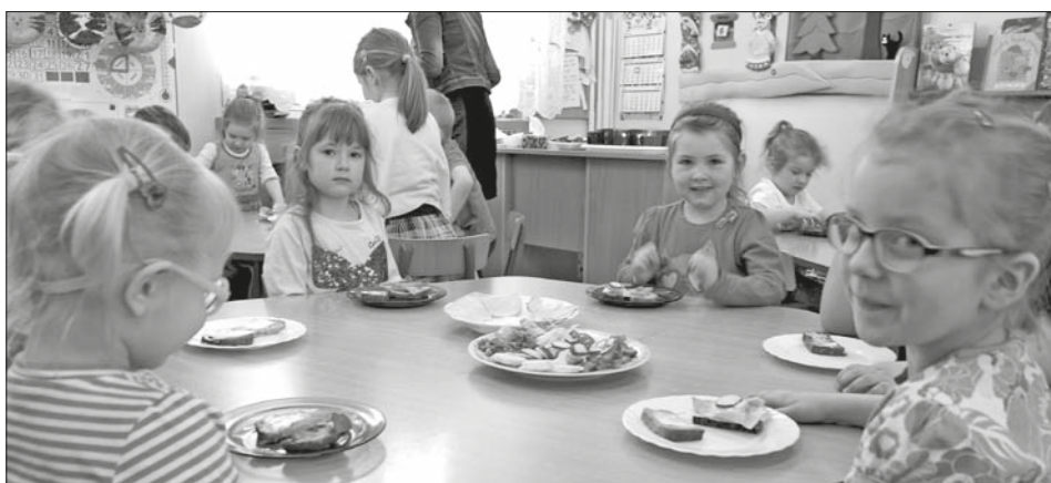
Przedszkolaki jedzą zdrowe kanapki przygotowane przez siebie

– Uważam, że program „Zdrowy przedszkolak” jest bardzo przydatny. Dzieci uczą się chociażby praw-