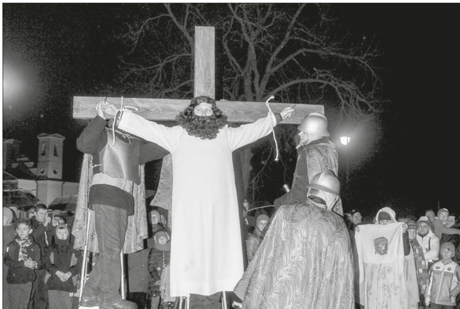
Ukrzyżowanie zabłudowskiego „Jezusa”

wany i złożony do grobu. W drodze towarzyszyła Mu Maria – Matka Jezusa, Jan – uczeń Jezusa, Weronika, Szymon Cyrenejczyk oraz żołnierze,